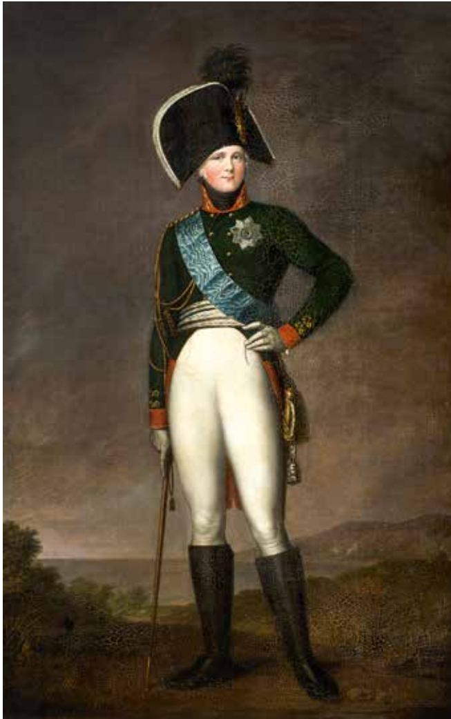
GERHARD VON KÜGELGEN 1772–1820