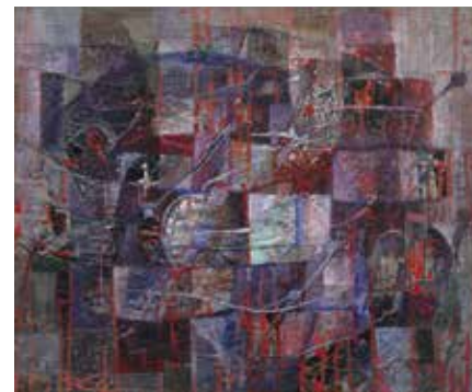
Kalast edasi. 1961. Õli, õlipastell, papp 42,5 × 35 cm. Tartu Kunstimuuseum

Aga alguste algus on ikkagi värvistiihia, fovismi üldistusest abstraktse ekspressionismi heiaastusini. Meid kõnetavad esmajoones värv, toon ja nüansid, mis annavad kujundeile eluõiguse, võimaldades neil saada märkideks ja sümboleiks. Seejuures on värvi teenistusse rakendatud kõiksugu võtteid: kleepimine, voolamine, pritsimine, tilgutamine, kraapimine, hõõrumine, trükkimine, kipsi või pastaga kruntimine, lõpetades juuksekarva vedamise ja kruupide külvamisega.