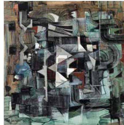
Must segadus. 1960 Kollaaž, õli, pastell, grafiit, paber. 38 × 37 cm Eesti Kunstimuuseum

Sürreaalseist salakäikudest aimub erootilisi allhoovusi („Mordist edasi”, segatehnika, kollaaž, 1961; „Lüüdi Haapsalu rannas”, õli, 1957).