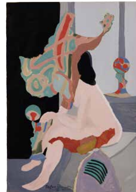
Aknast läbi. 1959/1960 Õli, kollaaž, paber. 58,6 x 40,7 cm Tartu Kunstimuseum

Neis katsetusis võib märgata kütkestavat sugulust Aleksander Suumani (1927–2003) poeetiliste portreede ja stiliseeritud maastikega, mis on pärit mõnevõrra hilisemast ajast. Suuman alustas kunstiõpinguid Tartu Riiklikus Kunstiinstituudis veidi enne seda, kui Janov oli sunnitud need katkestama.