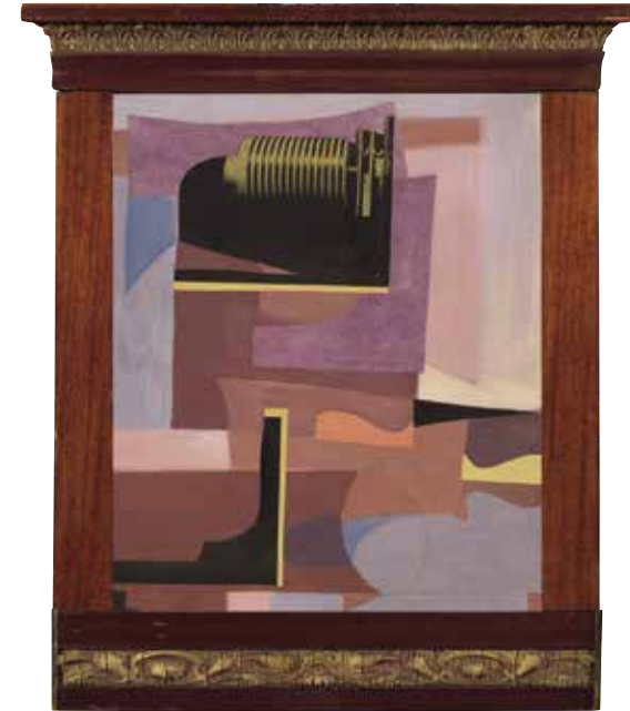
Kompositsioon vanale raamile. 1962 Kollaaž, paber. 42,5 × 35 cm. Tartu Kunstimuseum