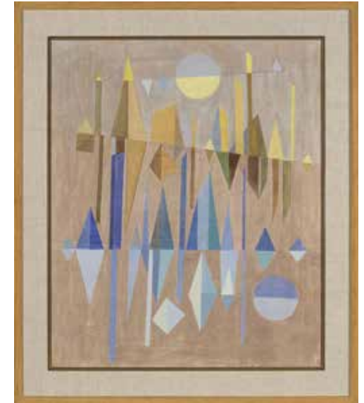
Samarkandi muljed. 1964 Tempera, lõuend. 65 x 55 cm. Erakogu