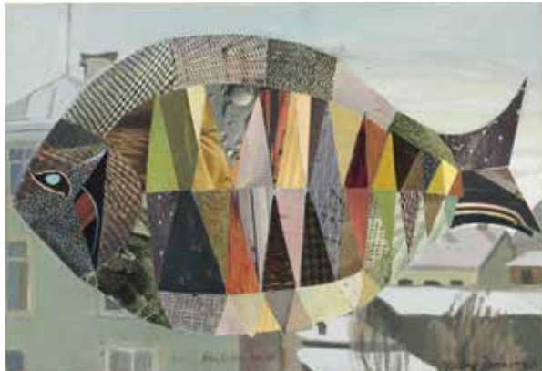
Kala Karlova kohal. 1960. Kollaaž, õli, paber. 31,8 × 46,7 cm Eesti Kunstimuuseum