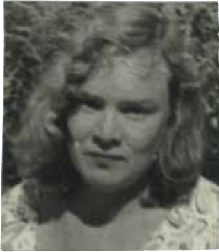
Valve Janov. 1960 (?)