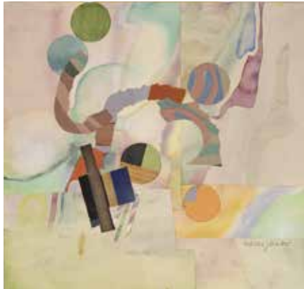
Pallimäng. 1963 Kollaaž, akvarell, grafiit, paber 31 x 37 cm. Erakogu