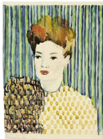
Autoportree. 1944 Akvarell, paber. 41,6 × 33,7 cm Tartu Kunstimuseum