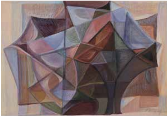
Ruumilised lõigud. 1959 Segatehnika, pastell, paber 27,5 × 39,5 cm Erakogu