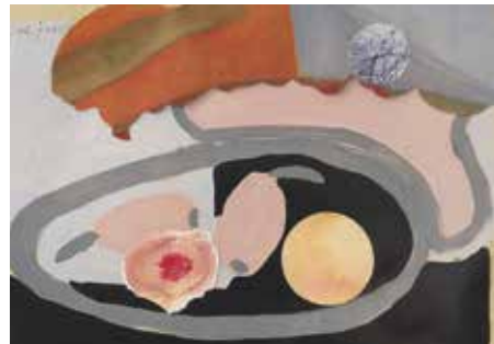
Mordist edasi. 1961 Segatehnika, kollaaž, kartong. 19,3 × 27,2 cm Margus Punabi kogu

Valve Janovi vanglaühiskonda trotsiv intuitsioon kunstikeele muutuste püüdmisel ja võimekus eri tehnikate rakendamisel avaldavad muljet. Tema avalikkuse eest varjatud loominguline maailm on hämmastavalt rikas, tundlik ja rõõmus, aga peentest närvikiududest nõrgub ka metafüüsiline ärevust. Janovi omailmas ärkavad kuulooded ja kasvavad kalad.