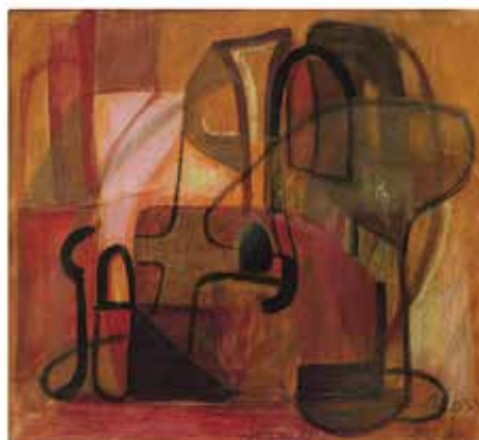
Väike arabesk punasel. 1958 Akvaarell, paber. Ava 14,6 x 16 cm Erakogu