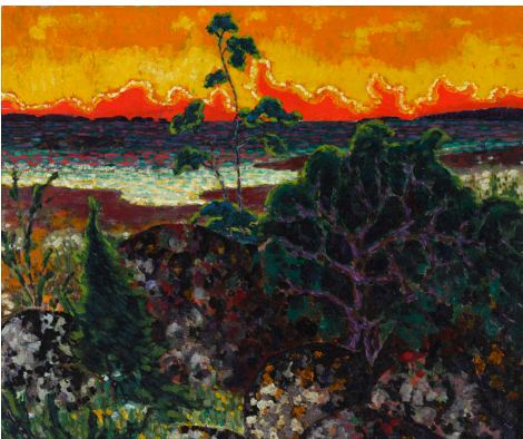
Konrad Mägi. Maastik punase pilvega. 1913-1914. Õli. Eesti Kunstimuseum

Kunstnik maalib teose Saaremaal puhates. Mis on kõige ilusam koht, kus sa oled käinud?