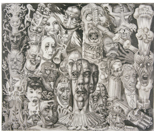
Eduard Wiiralt. Põrgu. 1930-1932. Ofort, vasegravüür. Eesti Kunstimuseum

Wiiralt 1930. aastate alguse töödel on kujutatud süngeid nägemusi olevikust ja tulevikust, mis peegeldavad toonase ühiskonna varjukülgi: suurlinnaelu probleeme, raha võimu ning populistide kasvavat mõjujõudu. Milline näeks välja sinu jaoks põrgu, kui see oleks paik või tegevus igapäevaelust?