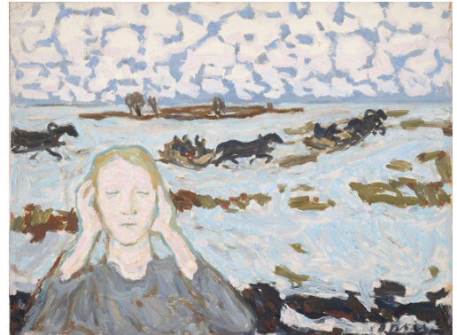
Olga Terri. Suletud. 1948. Õli. Eesti Kunstimuuseum