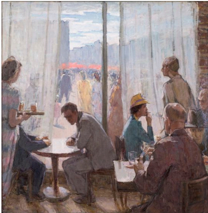
Leili Muuga. Kohvikus (Kahtlejad). 1956. Õli. Eesti Kunstimuuseum

Terri hoidis 1940.–1950. aastatel ametlikust kunstielust kõrvale ja maalis sel ajal mitmeid suletud ühiskonna hirme iseloomustavaid teoseid.