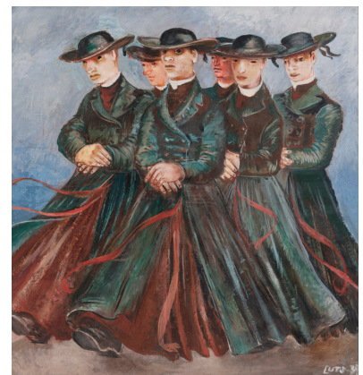
Karin Luts. Figuurid mustas. 1939. Õli. Eesti Kunstimuseum

Karin Luts oli kunstnik, kelle maailma kese oli tema ise. Seetõttu on kõik tema kujutatud tegelased natuke tema enda nägu (vt nt figuure sellel maalil). Kui sul oleks endast kloon, mida laseksid tal teha?