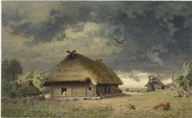
Johann Köler. Kunstniku sünnikoht. 1868. Õli. Eesti Kunstimuseum

Kunstnik on maalil kujutanud oma sünnikodu Viljandimaal. Mis loob sinu jaoks kodutunde?