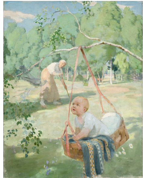
Paul Raud. Ema viis hälli heinamaale. 1912-1919. Õli. Eesti Kunstimuseum

Maalil on kujutatud päikeselist keskhommikut kaskedega ääristatud heinamaal. Mis on sinu kõige südamlikum mälestus lapsepõlvest?