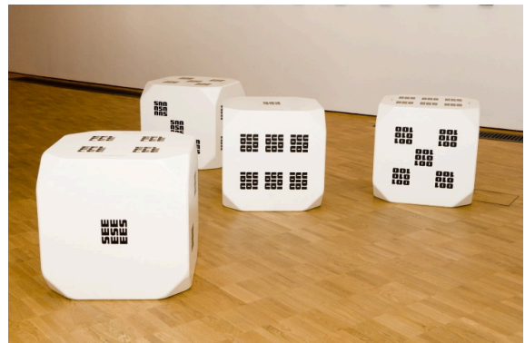
Raul Meel. Täringud 1–6. 1969/1994. Puitkiudplaat, paber. Eesti Kunstimuuseum