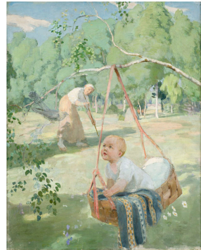
Пауль Рауд. Мать взяла колыбель на лугу. 1912–1919. Масло. Художественный музей Эстонии

На картине изображено солнечное утро на лугу, обрамленном березами. Какое твое самое теплое воспоминание из детства?