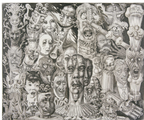
Эдуард Вийральт. Ад. 1930–1932. Офорт, гравюра на меди. Художественный музей Эстонии

На картине изображено солнечное утро на лугу, обрамленном березами. Какое твое самое теплое воспоминание из детства?