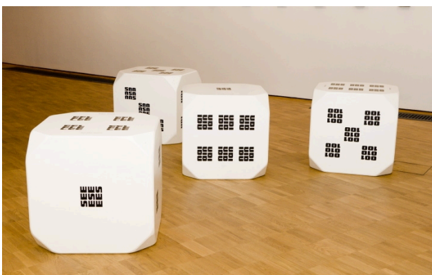
Рауль Меэль. Игральные кости 1–6. 1969/1994. ДВП, бумага. Художественный музей Эстонии

«Игральные кости» – первое произведение кинетического искусства в Эстонии. Меэль создал его для выставки молодых художников, состоявшейся в 1969 году. Какие из пяти чувств (зрение, слух, вкус, обоняние, осязание) ты бы себе оставил/а, если бы можно было выбрать только три?