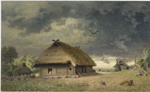
Йоханн Кёлер. Родная хижина. 1868. Масло. Художественный музей Эстонии

На картине художник изобразил дом, где он родился, в Вильяндиском уезде. Что создает для тебя ощущение дома?