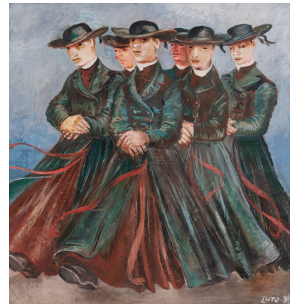
Карин Лутс. Фигуры в черном. 1939. Масло. Художественный музей Эстонии

Центром мира для художницы Карин Лутс была она сама. Поэтому все изображенные ею герои немного похожи на нее (например, фигуры на этой картине). Если бы у тебя был клон, что бы он для тебя делал?