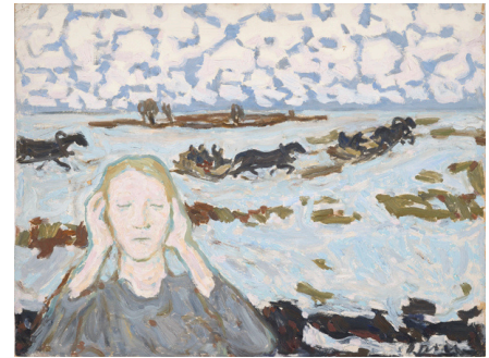
Ольга Терри. Страх. 1952. Масло. Художественный музей Эстонии

В 1940-х–1950-х годах Ольга Терри держалась в стороне от официального искусства, написав за этот период множество картин, отражающих страхи закрытого общества. Что больше всего пугает тебя?