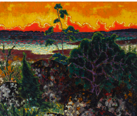
Конрад Мяги. Пейзаж с красным облаком. 1913–1914. Масло. Художественный музей Эстонии

Художник написал эту картину во время отдыха на Сааремаа. Какое место из посещенных тобой было самым красивым?