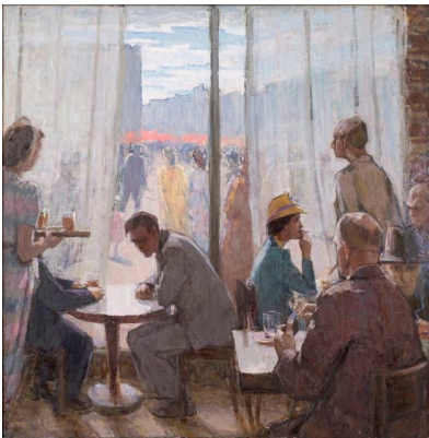
Лейли Мууга. В кафе (Сомневающиеся). 1956. Масло. Художественный музей Эстонии

На этой картине, написанной в период оттепели, косвенно отображен июньский переворот 1940 года – приход советской власти в Эстонию. Люди на картине не приветствуют приход советской армии, а наблюдают за происходящим на площади Свободы с сомнением и тревогой. Каким было твое самое запоминающееся посещение кафе?